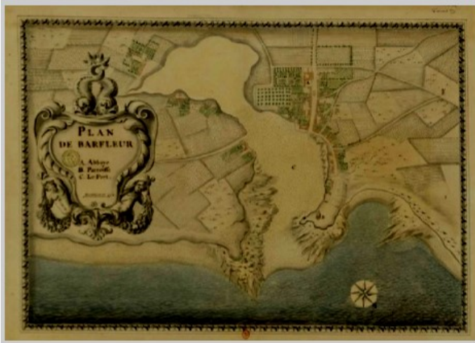
plan tiré de Recueil des cartes topographiques des côtes de Normandie, depuis Tréport jusqu'à Cherbourg avec les plans particuliers, de Sainte-Colombe, 1678. BNF, département Cartes et plans, GESH 1BPF33P6D

Barfleur fut le principal port de passage normand vers l'Angleterre au Moyen-Âge. C'est sur le rocher de Quillebeuf que la Blanche-Nef fit naufrage le 25 novembre 1120, emportant à jamais la descendance du Roi d'Angleterre Henri I er Beauclerc.